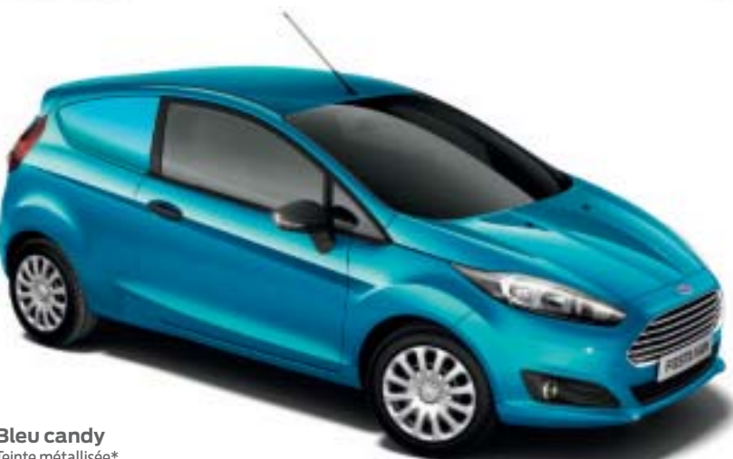
Bleu candy Teinte métallisée*