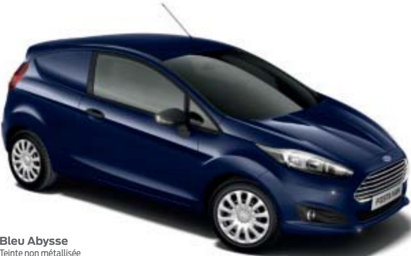
Bleu Abyssé Teinte non métallisée