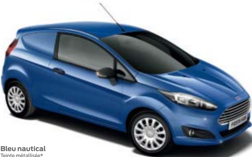
Bleu nautical Teinte métallisée*