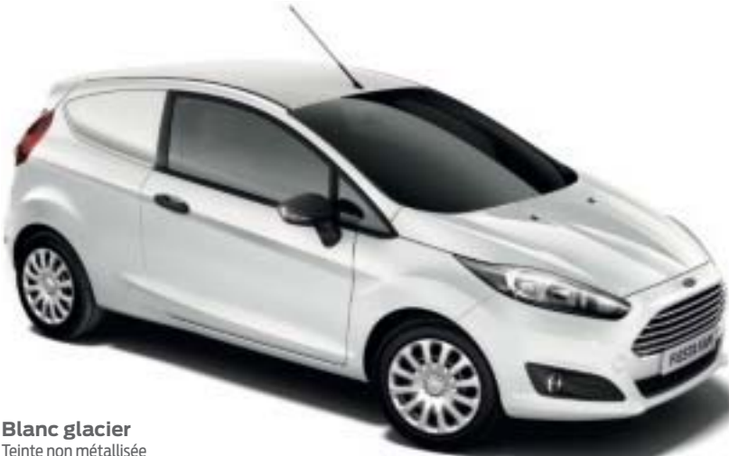
Blanc glacier Teinte non métallisée