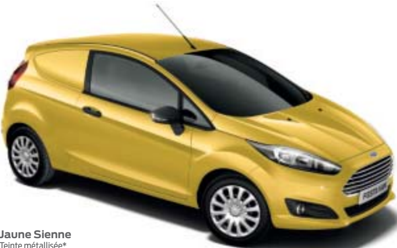
Jaune Sienne Teinte métallisée*