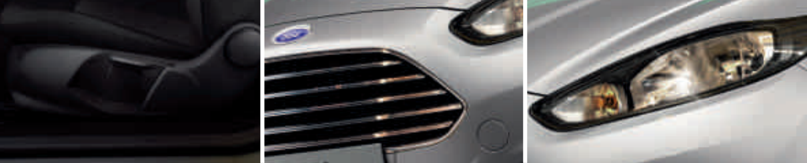
Siège conducteur réglable en hauteur