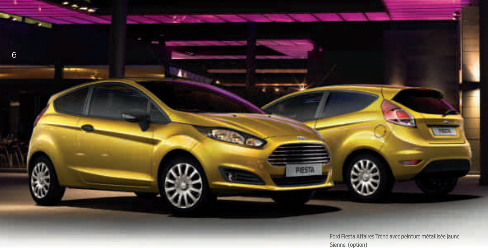
Ford Fiesta Affaires Trend avec peinture métallisée jaune Sienne. (option)