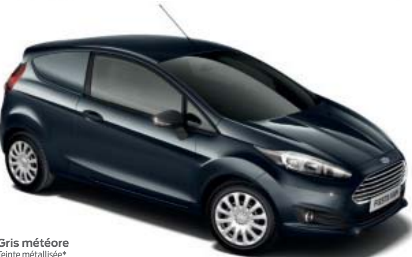
Gris météore Teinte métallisée*