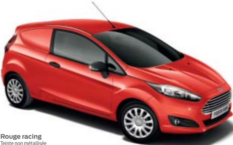
Rouge racing Teinte non métallisée