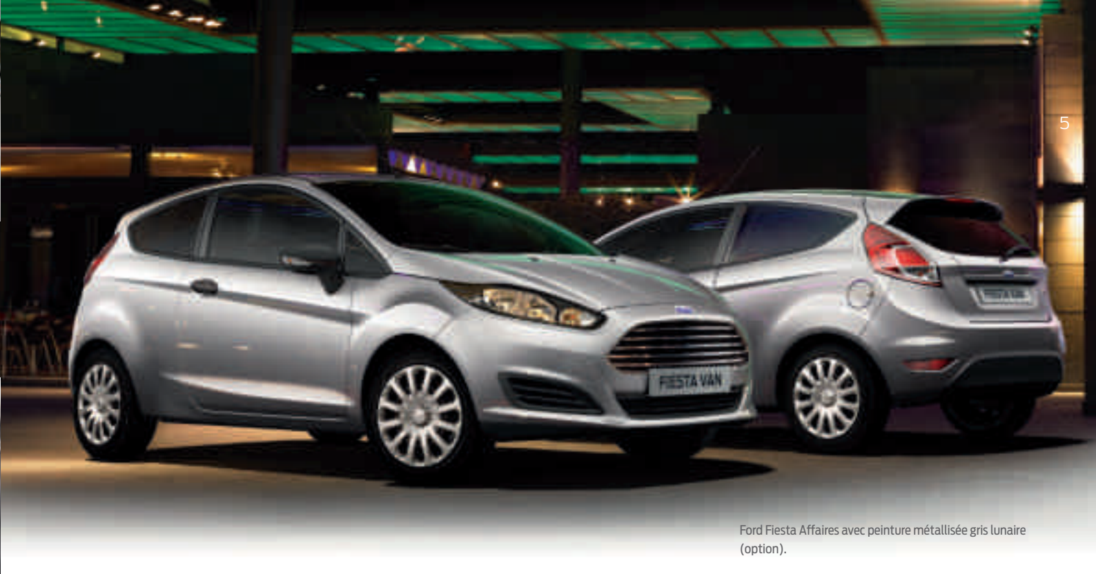
Ford Fiesta Affaires avec peinture métallisée gris lunaire (option).