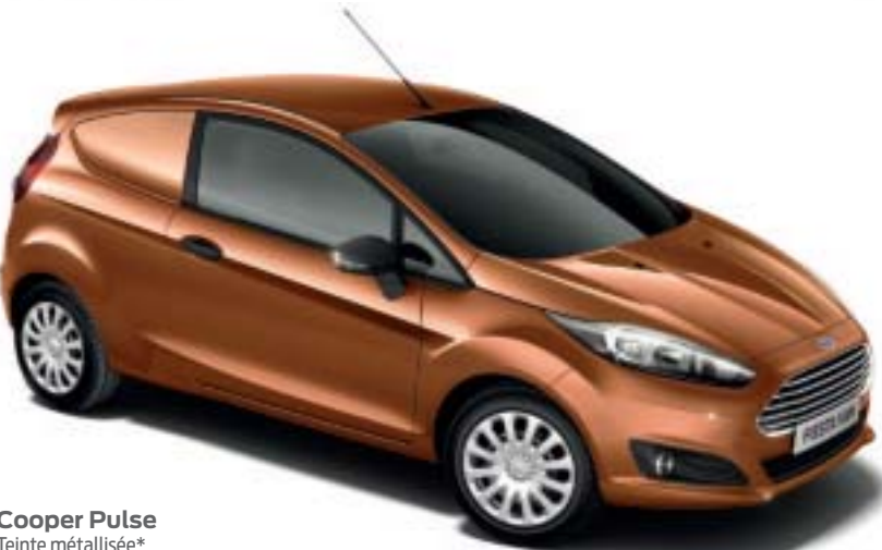
Cooper Pulse Teinte métallisée*