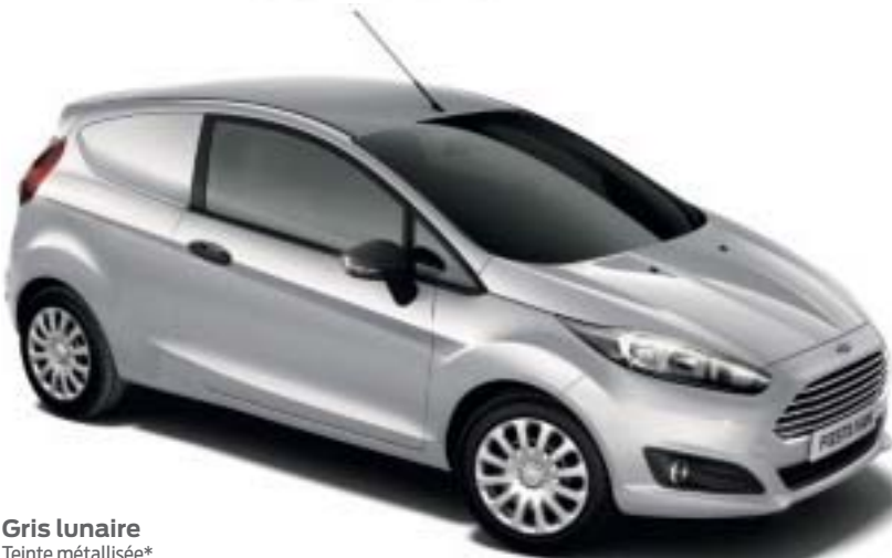
Gris lunaire Teinte métallisée*