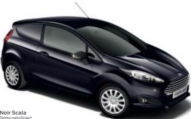
Noir Scala Teinte métallisée*